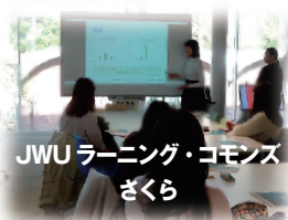
JWUラーニング・commons さくら

2019年4月3日、現図書館（目白）とともにJWUラーニング・commonsさくら（当初は仮称「ラーニング・commons」）がオープンした。これに伴い、ラーニング・commonsの周知を目的として、JWUラーニング・commonsさくらで年14回（中止回除く）、西生田図書館の泉ラーニング・スペース（西生田）で年2回の学修支援部会主催のミニ講座が開催された。