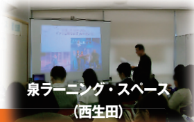
泉ラーニング・スペース (西生田)

受講者アンケートには、ラーニング・サポーターによる論文・レポートの書き方やプレゼンテーション方法に関する講座をまた開催してほしいなど、様々な期待が寄せられており、今後の開催に反映していきたいと考えている。