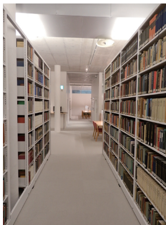
図書館（目白）地下1階電動式集密書架