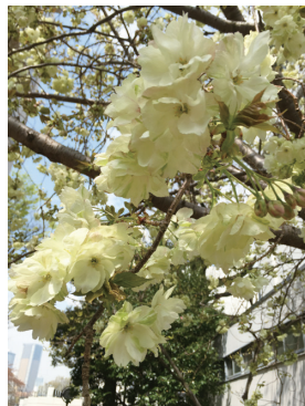
図書館（目白）入り口横の鬱金